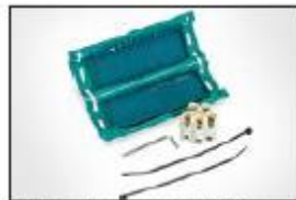
Gel kabelskjøt Relifix V 56, V516.