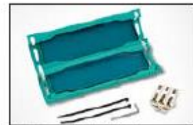
Gel kabelskjøt Relifix V 525.