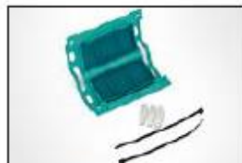
Gel kabelskjøt Relifix V 31,5.