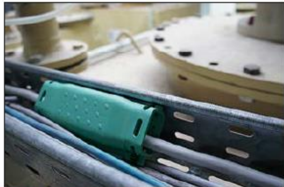
Gel kabelskjøt Relifix V i bruk som kabelreparasjon.