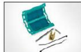
Gel kabelskjøt Relifix V 150.